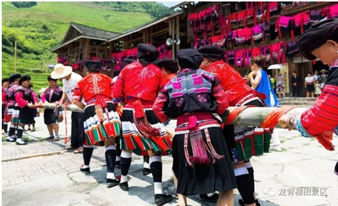
瑶族传统体育竞技“顶竹杠”比赛