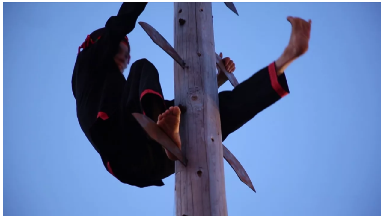
瑶族竹杠舞、上刀山表演