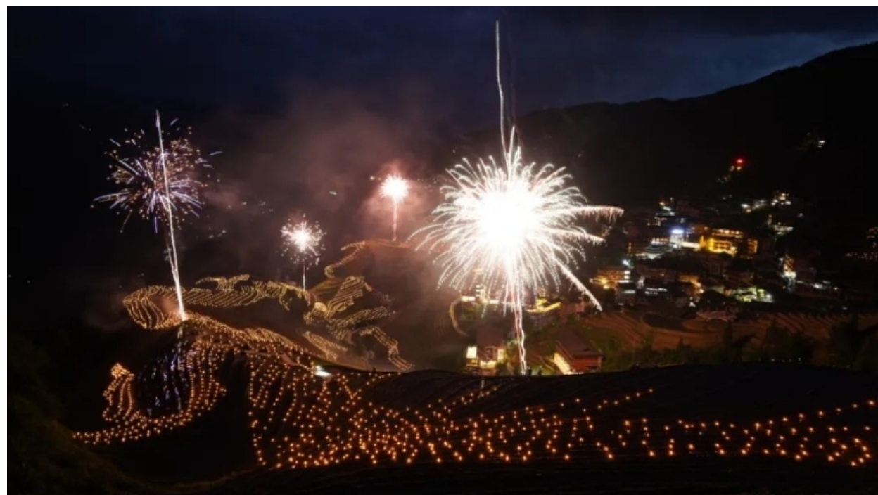
大型梯田火把夜景