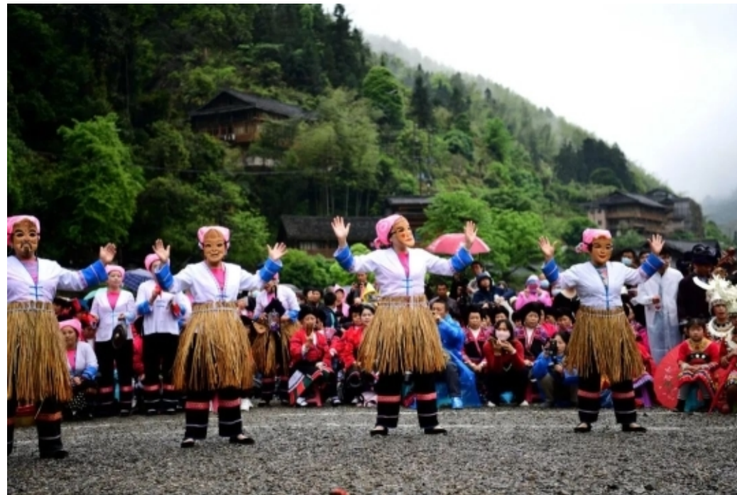
神秘的壮族师公舞(少女成年礼)