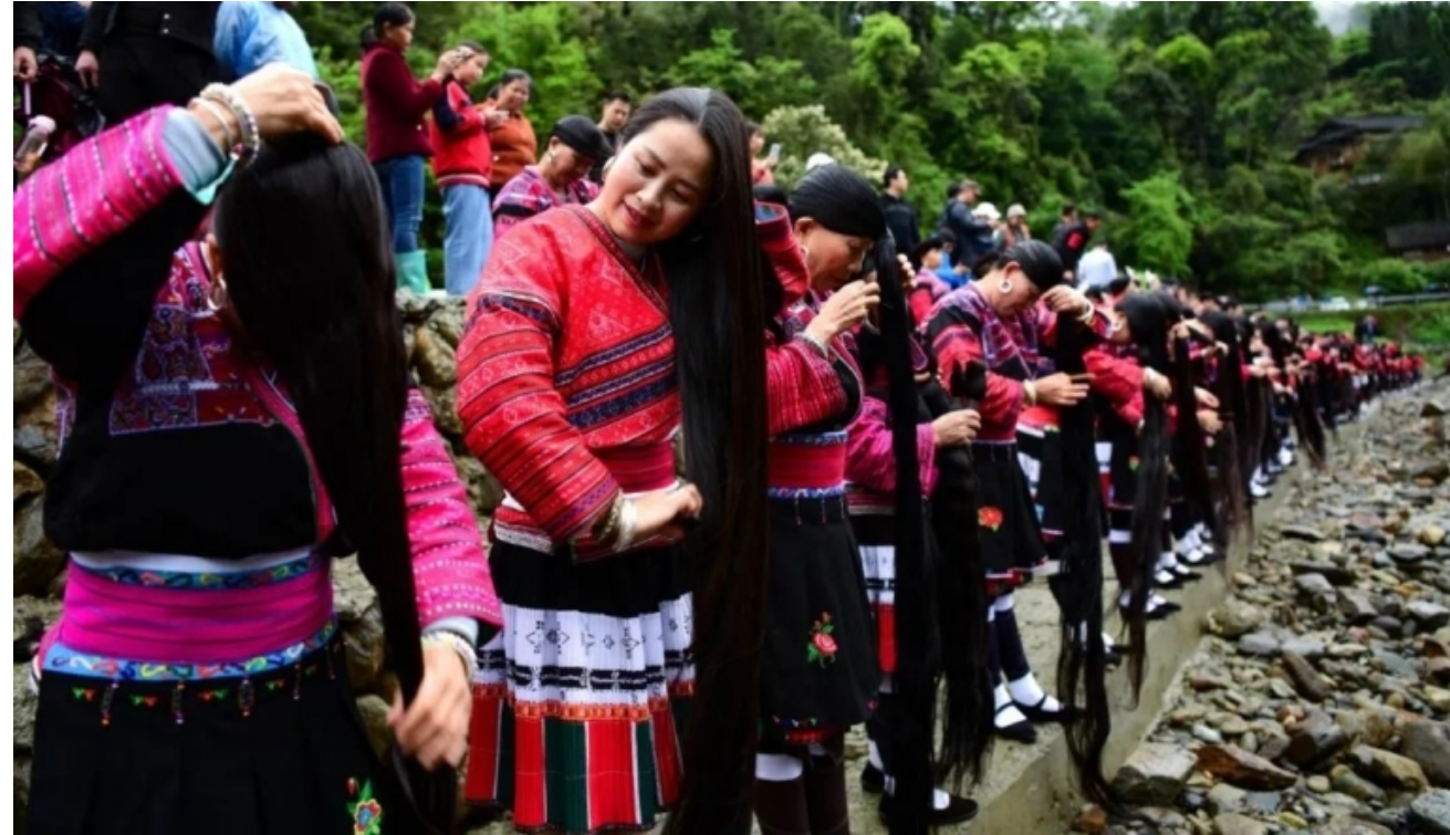
红瑶集体长发梳妆