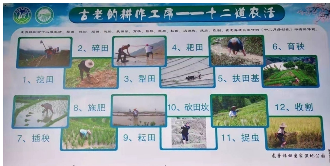
龙脊梯田古老的耕作方式：十二道农活

2014年红瑶服饰被列为 国家级非物质文化遗产，瑶族药浴疗法、红瑶长发习俗、北壮服饰制作技艺、北路壮族唢呐套曲、龙脊水酒酿造技艺列入为自治区级非物质文化遗产，另外还有龙脊梯田造田技术等10项市级非物质文化遗产。