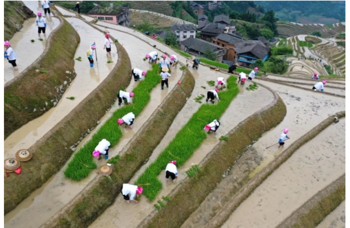
大型集体插秧劳作