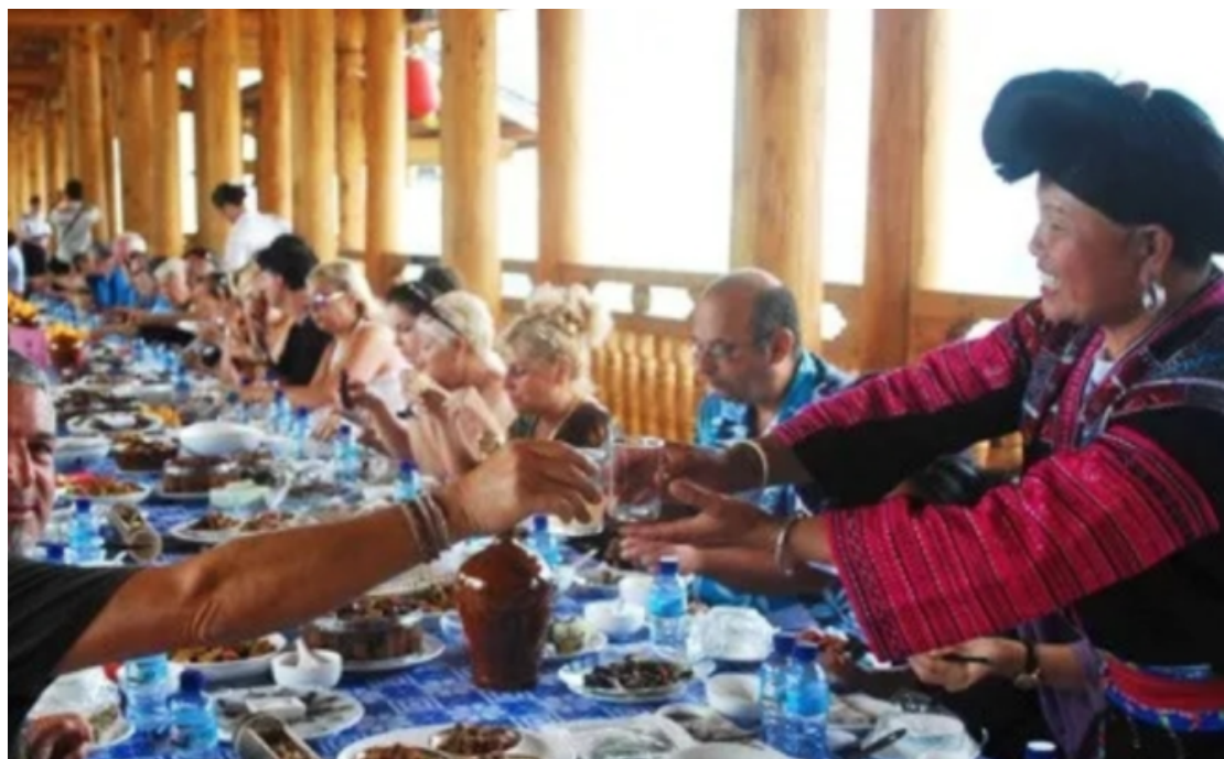
“各民族团结一家亲”长桌宴