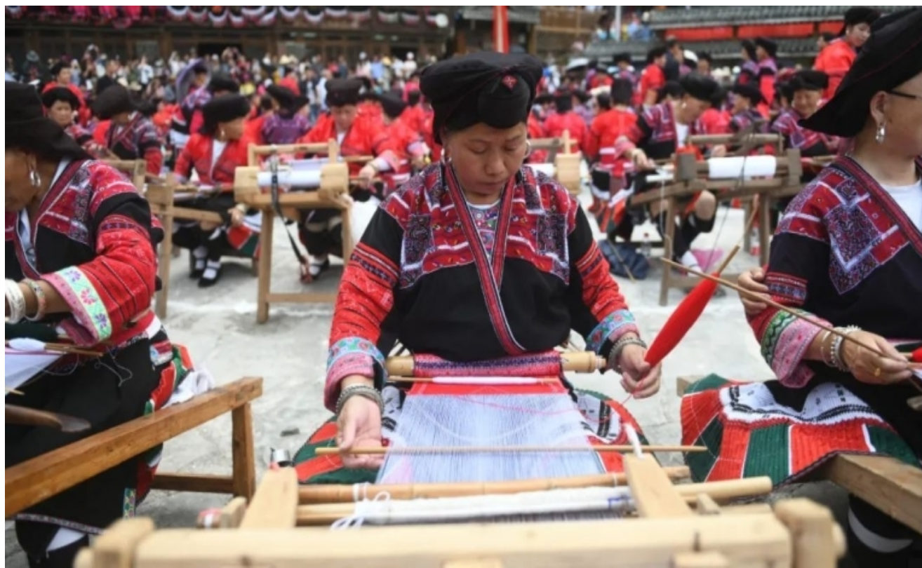
红瑶服饰加工展示